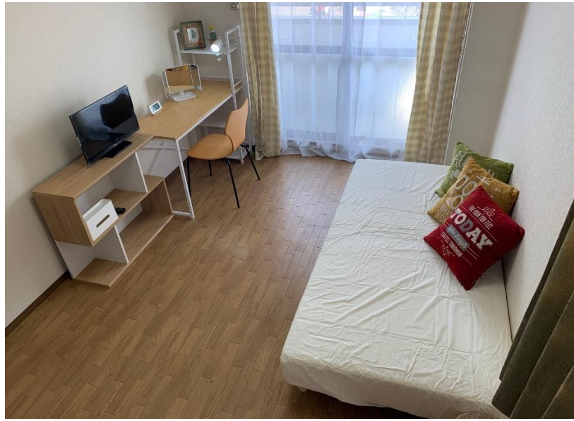
大阪府枚方市村野本町 村野駅徒歩2分 1K 洋室7・5帖 23㎡