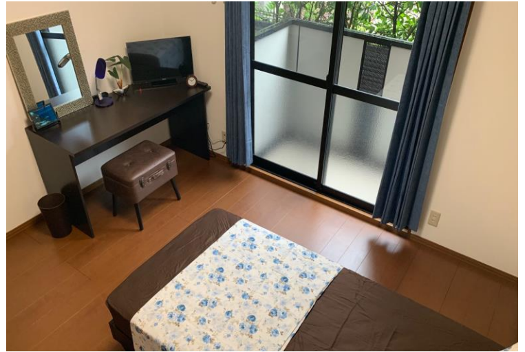
大阪府枚方市北中振 光善寺駅徒歩3分 1K 洋室8帖 26.9㎡